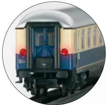
Voorbeeldgetrouw met staartlicht