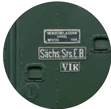
Gemonteerde, geëtste locborden

Ter gelegenheid van het 100-jarige jubileum van de VI K Gelimiteerde oplage van 399 stuks Met certificaat van echtheid