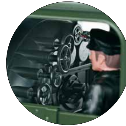
Zelfs de machinistencabine van het model is liefdevol en gedetailleerd uitgevoerd – inclusief machinist